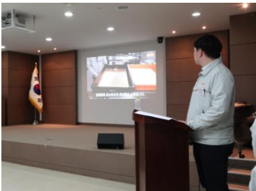
<자사 소식 공유>

비에이치는 매달 열린 소통의 장을 개최하여 상하간 소통 활성화를 통한 조직문화 유연성 확보에 앞장서고 있습니다