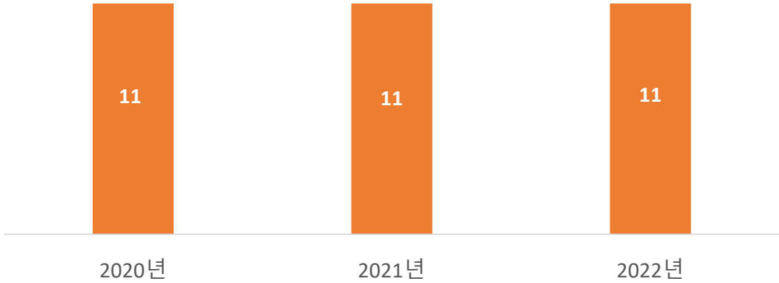
ESG 마인드셋 교육 진행 현황

※ 2020년~2022년 코로나19로 뉴스레터 등 온라인 교육으로 대체함