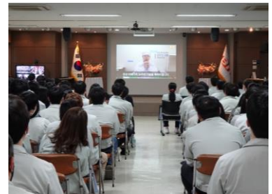
<해외 법인 소식 공유>

우수사원 시상으로 함께 근무하는 동료의 우수 사례를 공유하며 상하 및 동료 간의 교류를 하고 있습니다.